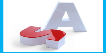
Plexiglass Kutu Harf