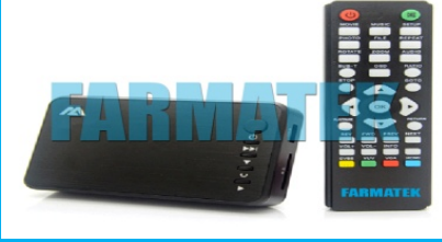
Hdmi Dvd - Medya Player