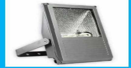
200 Watt Metal Halide