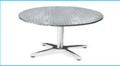
Metal Yuvarlak Masa