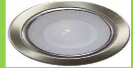
Dome Light 15 Watt