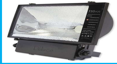
400 Watt Metal Halide