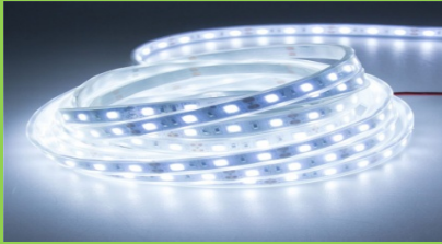
Serid Led Beyaz 3 Çipli