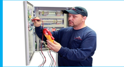
Elektrik Makinesi Devreye Alma