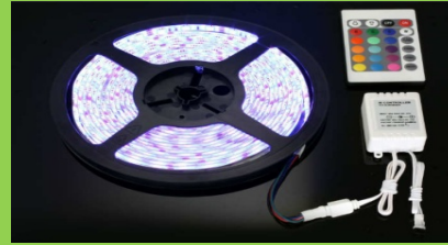
Serid Led RGB 3 Çipli