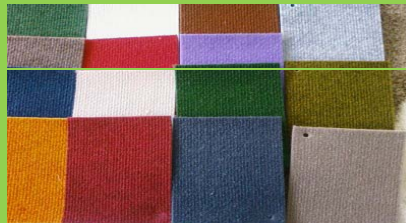
Haliflex 1m 2