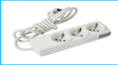
3 lü Priz