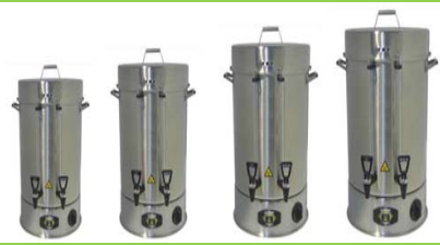
Endüstriyel Çay Cihazı