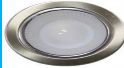
Dome Light 3 Watt