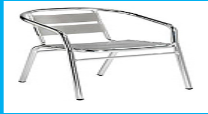
Metal Yuvarlak Masa Sandalyesi