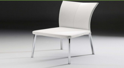
Cam Masa Sandalyesi