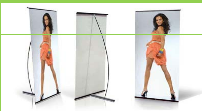
Quik Banner ( Baskı Dahil )