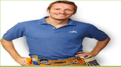
Dijital Baskı Uygulama Elemanı