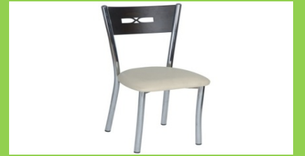
Kare Masa Sandalyesi