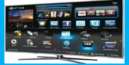
Led TV 50"