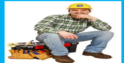
MARANGOZ ve KURULUM İŞÇİSİ