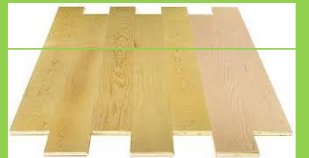
İthal Parke 1m 2